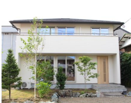
↑自然石や雑木風の木々と調和した外観