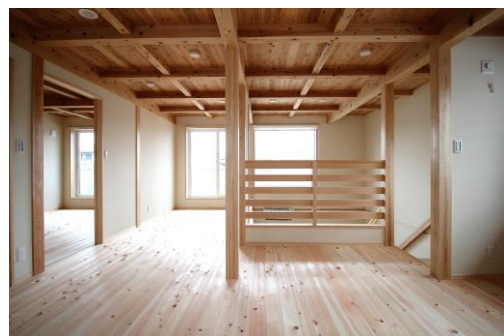
↑間仕切りの少ない広々とした2階、暮らしの変化にも対応できるつくり